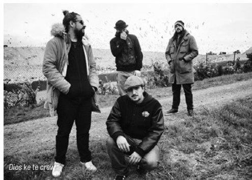
Dios ke te crew